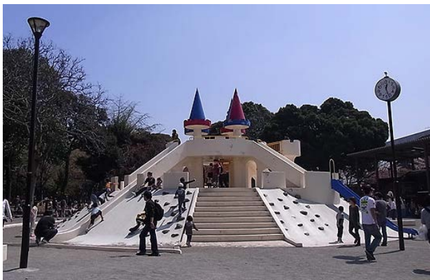
みどりがいっぱいの5月例会でした。